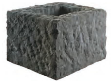
Planter made of sharpened sandstone, 30 × 25 × 25 cm.