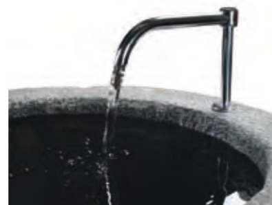
Chromed brass on a granite cylinder, 70 cm.