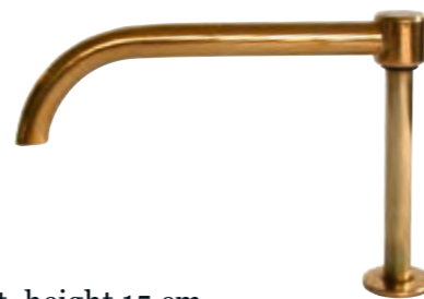
brass spout, height 15 cm.

The spouts vary in shape and size. They can also be fitted to the well. Brass is more weatherproof and frost-resistant. The spouts are also available with layers of beaten gold.