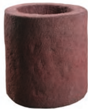
Measurements: 40 x 40 cm, weight approx. 80 kg.