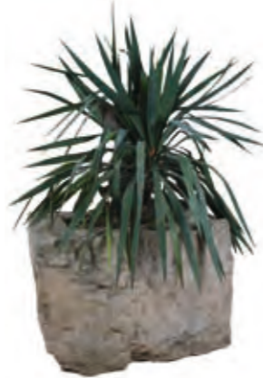
80 × 60 × 60 cm (with palm tree) , weight approx. 400 kg.