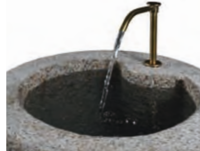
Natural brass on a granite cylinder, Ø50 cm.