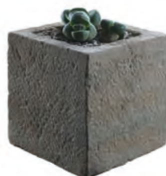
20 × 20 × 20 cm, weight approx. 5 kg.