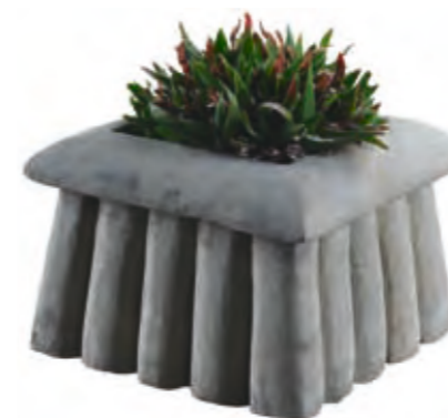
Planter, 12 × 12 × 10 cm in yellow sandstone, also 40 × 40 × 30 cm in red sandstone.