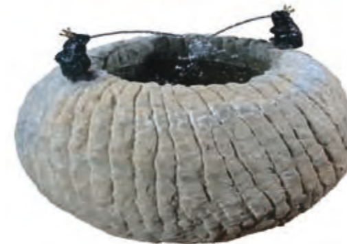
Frog and draw well sharpened in sections. Diameter 55 cm, height 40 cm. Weight 120 kg.