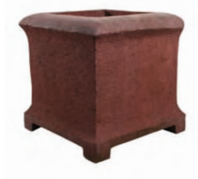
Planter made of red sandstone, 60 × 60 × 60 cm, approx. 200 kg.