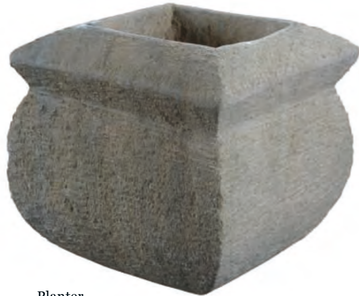
Planter made of sandstone, 40 × 40 × 32 cm, approx. 70 kg.