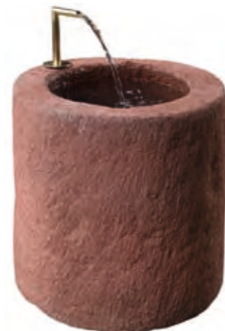
Red sandstone (above), yellow sandstone (below). Diameter 40 cm, with a round angle spout.