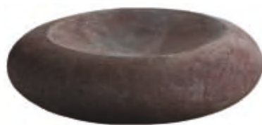
Plate made of sandstone, green, yellow or red. Ground surface, Ø40, height 10 cm.