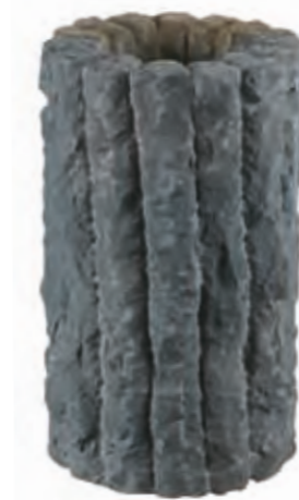
Diameter 20 cm, height 40 cm, approx. 10 kg.