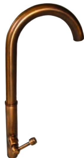
Water intake with stop valve, height 46 cm.