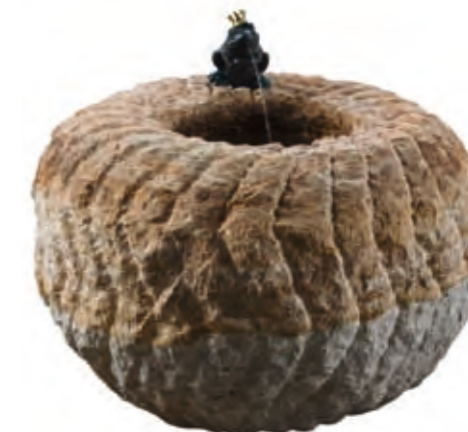
Sphere made of sandstone, sharpened in sections. Diameter 45 cm, height 30 cm, weight 80 kg.