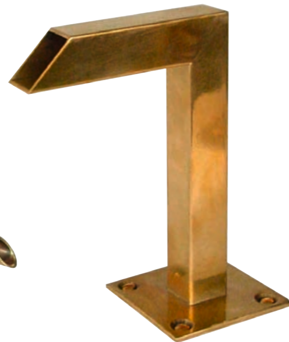
Rectangular angle spout, height 10 cm.

The spouts vary in shape and size. They can also be fitted to the well. Brass is more weatherproof and frost-resistant. The spouts are also available with layers of beaten gold.