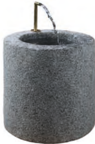
Grey granite, Ø40 cm, height 40 cm, bush-hammered, approx. 90 kg.