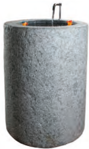
Grey granite, Ø70 cm, height 90 cm, bush-hammered, approx. 600 kg.