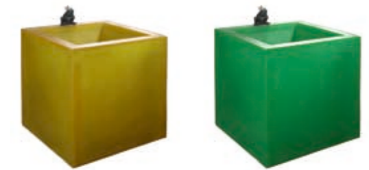
Measurements: 40 × 40 × 40 cm, weight approx. 5 kg.

with a frog king, available in yellow, orange, green and white/opaque. Polyester is a weatherproof material. For the use in the outdoor area, the well is provided with a drain plug that must be unscrewed by an attached spanner at the beginning of winter. The circulating pump remains in the well and can be protected by a freezer bag until the well season in the sunny time of the year starts again.