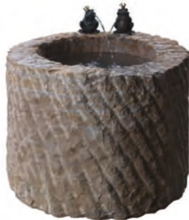
Sandstone, sharpened in sections. Diameter 50 cm, height 40 cm. Below: Granite, Ø40 cm, height 30 cm.

Well with a frog king made of yellow sandstone.