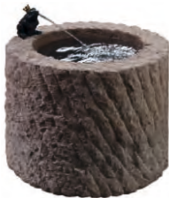
Yellow sandstone, Ø40 cm, height 30 cm, sharpened, approx. 70 kg.