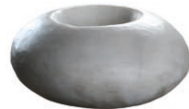
Plate made of white or green marble, honed, Ø40, height 20 cm. Also available as Elphonia Ø50, height 20 cm or as Emphonia Ø70, height 30 cm.