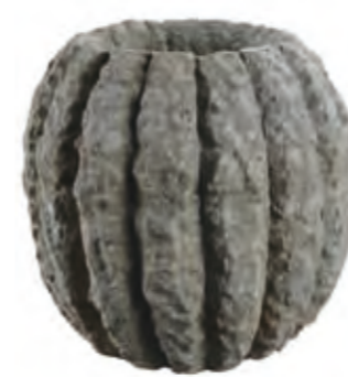
Flower pot, Ø20 cm, height 20 cm, approx. 3 kg.