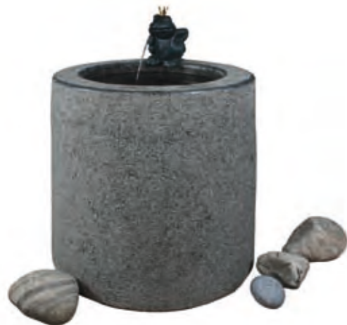
Granite, diameter 50 cm, height 50 cm with polished edges. The frog king is 16 cm high. His right arm rests on his hip.

A cylindrical well always finds its place. Round fits almost everywhere. Nearly every measurement is available in all common materials. 40 × 30 cm is a proven measurement for smaller balconies and terraces. The 50-cm-well is a bit more weighty, but may be mounted with two frogs someday.